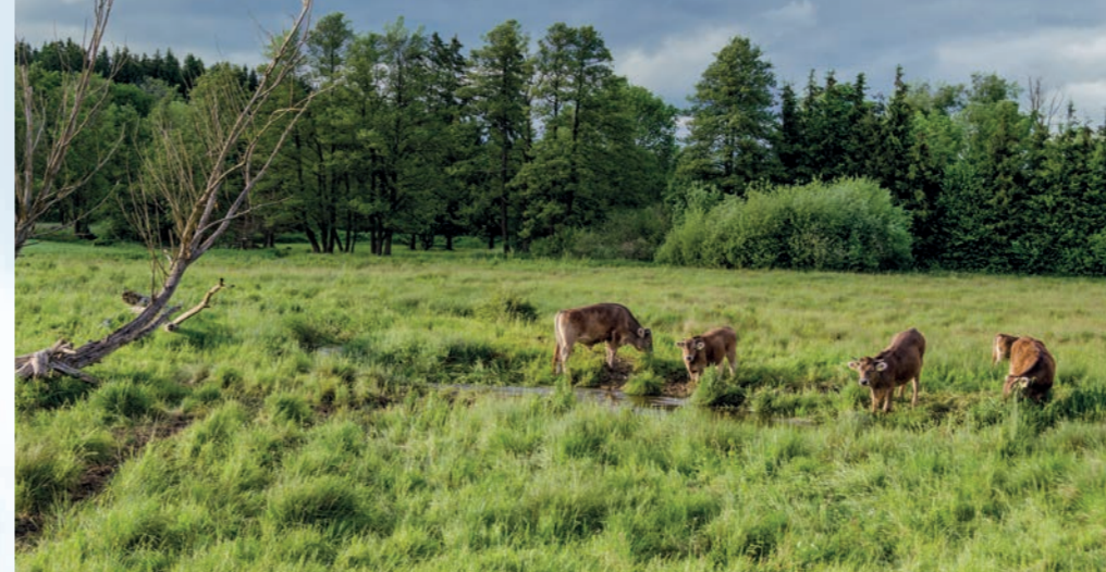
Westliche Günz mit Günztal Weiderindern

Da das Vertragsnaturschutz-Programm im Günztal nur wenig angenommen wurde, sollten neue Wege für zukünftige Förderprogramme gefunden werden. Mit Unterstützung von Experten aus Verwaltung und Praxis wurde 2017