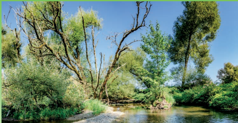
Bild: Westliche Günz

Das Günztal ist Heimat und Regenerationsquelle für uns alle. Für viele Tiere und Pflanzen ist es das letzte Refugium. Doch nur 1% des Günztals steht unter Naturschutz. Die Günztal-Stiftung setzt sich seit 20 Jahren dafür ein, der bedrohten Natur an der Günz mehr Raum zu geben und ihre Artenvielfalt zu schützen. Ganz praktisch bedeutet das: Wir schaffen entlang der Günz neue Biotope und verbinden sie miteinander. In diesem Biotopverbund kann sich die Natur wieder selbst regenerieren. Unsere gemeinnützige Arbeit lebt von vielfältigem Engagement: Ob Fördermitgliedschaft, aktive Mitarbeit oder Spende – jede Art von Unterstützung hilft dabei, die natürliche Lebensader unserer Region zu bewahren.