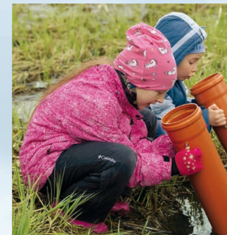
„Naturforscher“ bei der Arbeit

Einen wichtigen Beitrag zum Erfolg des Grünland-Projektes lieferte auch die begleitende Öffentlichkeitsarbeit. Bei den Exkursionen und Vorträgen der vergangenen 5 Jahre wurden über 3.000 Teilnehmern die Ziele und die Bedeutung der Naturschutz-Projektarbeit im Günztal vor Augen geführt. Einzelne Großveranstaltungen, wie z.B. der „Schwäbische Wiesentag“ haben auch überregional für Aufmerksamkeit gesorgt. Der Flyer „Wilde Bluma“ informiert zum Thema „Ansaat von Wildpflanzen“. Auch im Bereich Umweltbildung wurden weitere Grundsteine zur Kooperation mit Schulen und Gemeinden gelegt. So werden wir die Grundschule Kettlershausen künftig bei einer „Tümpel-Patenschaft“ betreuen.